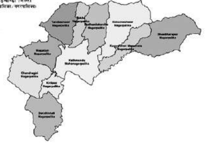
काठमाण्डौं जिल्ला (नगरपालिका / नगरपालिका)

काठमाण्डौं जिल्लामा कुल ११ वटा स्थानिय तहहरू छन्। ति मध्य १ महानगरपालिका (काठमाण्डौं महानगरपालिका) र १० नगरपालिका (शंखरापुर, कागेश्वरी मनहरा, गाकर्णेश्वर, बुढानिलकण्ठ, टोखा, तारकेश्वर, नागार्जुन, चन्द्रागिरी, दक्षिणकाली र किर्तिपुर नगरपालिका) हुन।