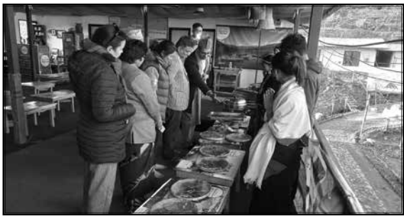
मौलिक भान्साघर, कपन काठमाण्डौ