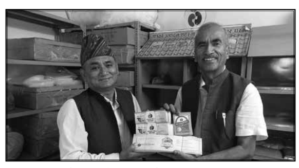
प्याकेजिङ लेवलिङमा सहयोग कार्यक्रम, धुम्बराही