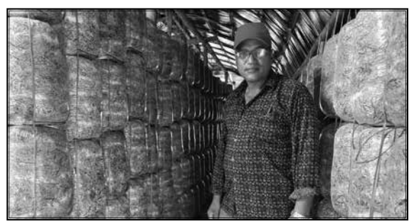
च्याउ प्रवर्दन कार्यक्रम, चाँगुनारायण, भक्तपुर