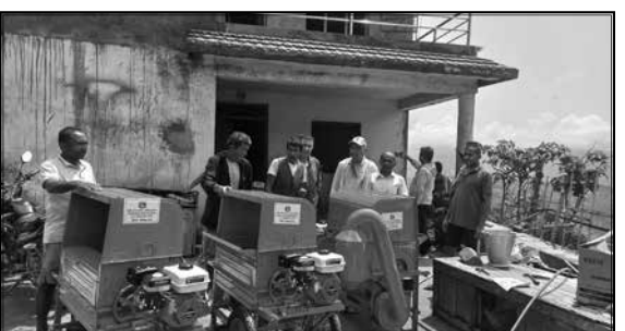
रैथाने वाली प्रवर्दन, थ्रेशर वितरण शंखराप्र