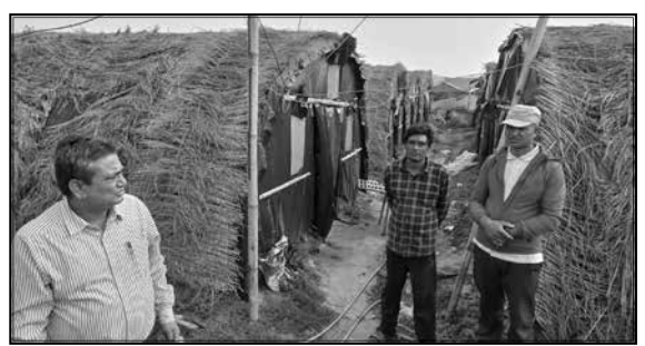
च्याउ प्रवर्दन कार्यक्रम, मुलपानी