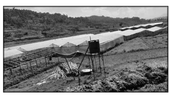
बिउपुँजी कार्यक्रम शंखरापुर