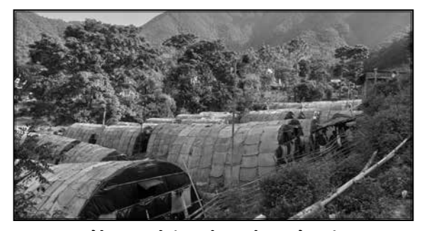
गोब्रे च्याउ खेती प्रवर्दन कार्यक्रम, गोदावरी