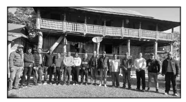
अध्ययन अवलोकन भ्रमण, झापा