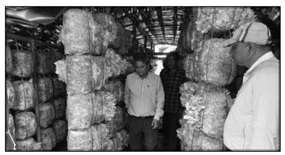
च्याउ प्रवर्दन कार्यक्रम, कागेश्वरीमनोहरा