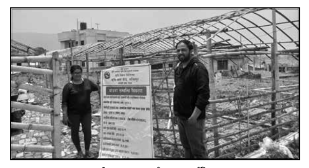
तरकारी ब्लक कार्यक्रम, सुर्यविनायक