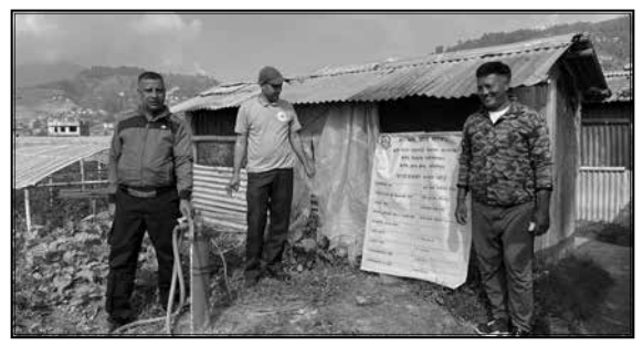
साना सिंचाइ कार्यक्रम, वोरिङ निर्माण