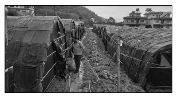
च्याउ प्रवर्दन कार्यक्रम, सुर्यविनायक