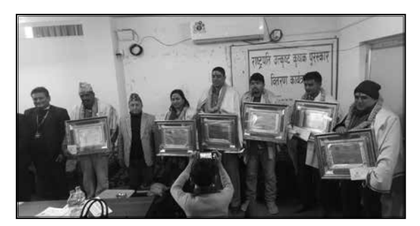
राष्ट्रपति पुरस्कार वितरण कार्यक्रम