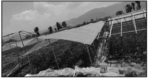
PMAMP तरकारी ब्लक कार्यक्रम, चाँगुनारायण, भक्तपुर