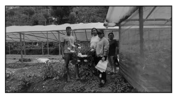
तरकारी ब्लक दक्षिणकाली....