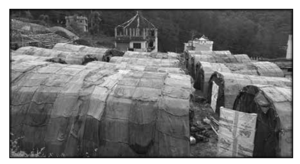
च्याउ प्रवर्दन कार्यक्रम, चन्दागिरी