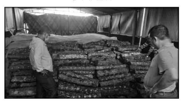
सिताके च्याउ प्रवर्दन कार्यक्रम, गोदावरी