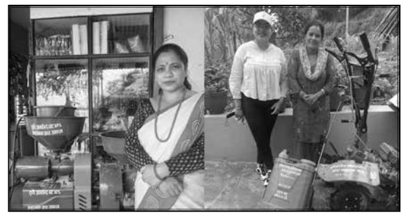
कृषि यान्त्रीकरण कार्यक्रम, कम्बाइन मिल वितरण कार्यक्रम