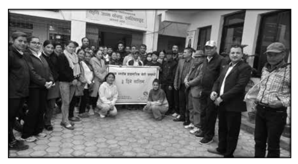
प्राङ्गारिक खेती सम्बन्धी ३ दिने तालिम